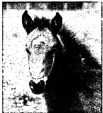
Poulain New Forest, Telbia de la Mercerie

éducation adaptées à leur âge et à leur évolution, présentations en concours.