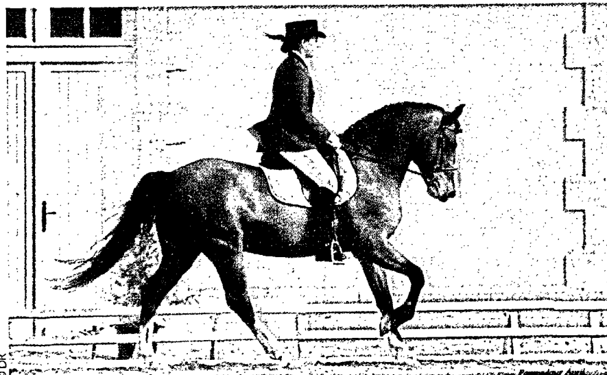
Etoile d'Hardy, étalon New Forest