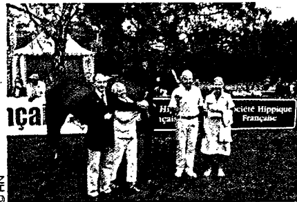
Remise des prix du championnat régional des poulinières sur le Grand Parquet de Fontainebleau en 2008

sont saillies en dehors de la région. En effet, on note l'absence d'étalons de courses dans la région et une forte attractivité de la Normandie, région voisine.