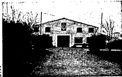
Haras national des Bréviaires

En 1973, l'Île de France devient une circonscription des Haras nationaux à part entière avec l'implantation du Haras national sur la commune des Bréviaires, dans les Yvelines.