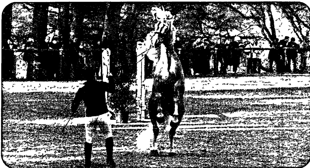
90 % des chevaux sont considérés comme occasionnellement nerveux lorsqu'ils sont montés et/ou manipulés