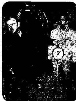
Tester le poids de foin distribué à l'aide d'un peson

Pour le foin, tester régulièrement la masse distribuée.