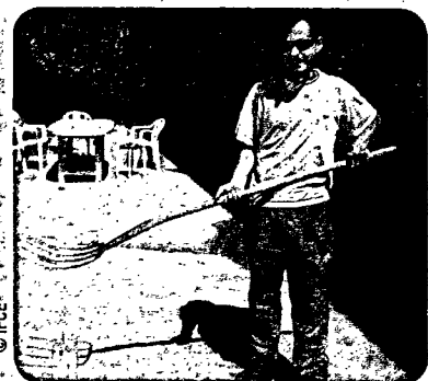
... ou d'une fourche à laquelle un poids est suspendu