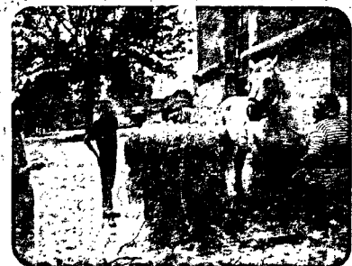
Pesée mensuelle au Haras du Pin

Le suivi des pesées et de l'état corporel, ainsi que l'avis du soigneur et du cavalier ou meneur (si le cheval est au travail), doivent permettre de décider en toute connaissance, et après une discussion collégiale, d'un maintien ou d'une modification de régime alimentaire.