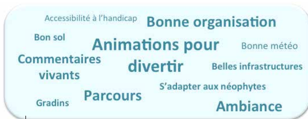
Figure 2 / Regroupement des attentes les plus ressorties par les participants et spectateurs étudiés

Comme le suggère la figure ci-dessous, les participants et spectateurs s'intéressent à des éléments communs. Pour autant, en analysant les attentes, ces dernières semblent plus complexes. Ainsi, un même thème abordé par spectateurs et participants va détenir des éléments propres aux spectateurs, et d'autres attentes propres aux participants.