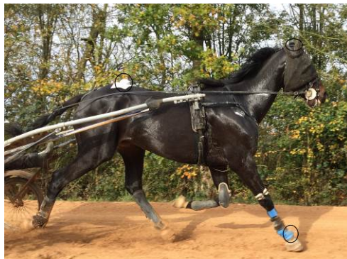
Photo IV: capteurs du Lameness Locator ® et fiche de résultats Photo IV: Lameness Locator ® sensors and results sheet

Cependant un autre système accélérométrique apparaît maintenant dans les cliniques vétérinaires : le Lameness Locator ® d'Equinosis LLC. Ce système, développé au sein de l'Université du Missouri, permet une analyse de la locomotion objective dans des conditions de terrain et en temps réel. Ce système se compose de 3 capteurs inertiels fixés sur le paturon droit, la nuque et la croupe, transmettant en Bluetooth les informations vers une tablette. Les différences de variation des hauteurs de tête et de croupe au cours du cycle locomoteur sont déduites à partir d'algorithmes complexes. Les asymétries antérieures et/ou postérieures sont proportionnelles à la différence des hauteurs minimales et maximales respectivement de la nuque ou du sacrum et quantifiées sur ce principe. Des protocoles de validation (Keegan et al 2012, McCracken et al 2012) confirment que, utilisée en complément de l'évaluation visuelle, le système permet ainsi d'obtenir des données quantifiées de la boiterie.