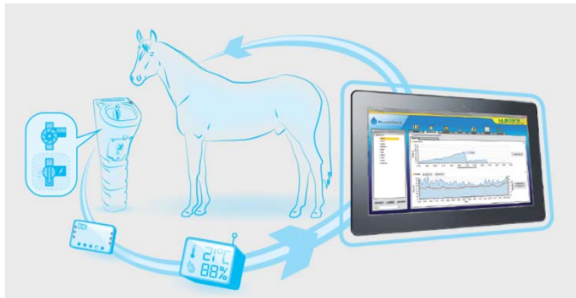
Photo II : Système Blue intelligence® Photo II: Blue Intelligence® system

Outre l'investissement financier pour équiper les écuries, une des limites pourrait être que ces systèmes de contrôle d'abreuvement ne sont utilisables que pour les chevaux au box 24 h/24. Or il est fréquent, dans le milieu du trot et secondairement dans celui de l'obstacle, que les chevaux passent une grande partie du temps au paddock.