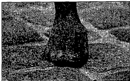
Marque au fer dans la corne

Sur les sabots, les marques rencontrées sont des marques au fer dans la corne. Ce sont des matricules militaire, sanitaire ou d'élevage.