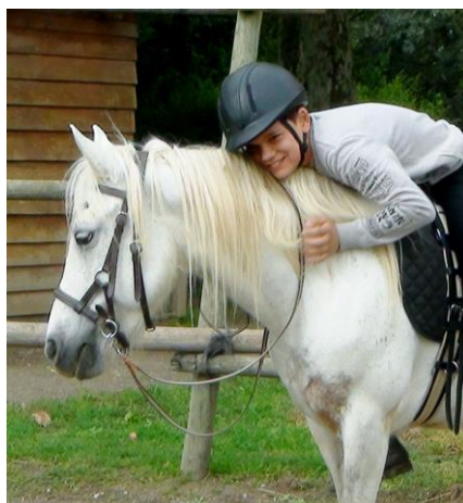
Fig.1 Exemple de bridon sans mors utilisé

Pour un même couple cavalier-cheval, nous avons donc observé deux séances identiques, réalisées à la fois avec et sans mors. La moitié commençait par la condition « avec mors » la seconde par la condition « sans mors » avec un bridon de type sidepull, adapté à la taille du cheval/poney (fig.1 ci-contre).