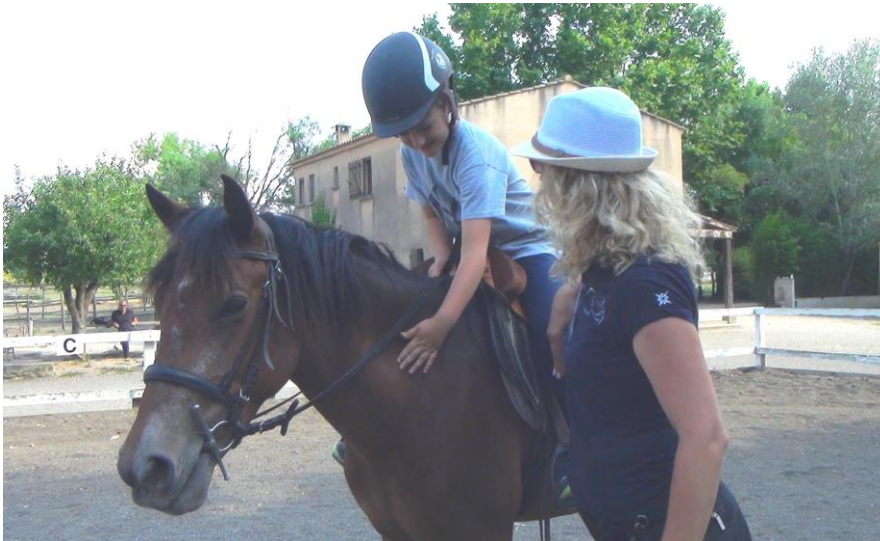
Comportement oral (mâchouillement) lors d'une séance avec mors

L'utilisation de bridons sans mors constitue une alternative aux traditionnels bridons avec mors, qui permettrait d'éviter blessures et stress reportés dans de précédentes études. Nous avons donc cherché à savoir si le mors pouvait avoir un réel impact négatif sur le confort du cheval lors de séances d'équithérapie. Pour cela nous avons observé 20 séances identiques 2 à 2, dont 10 séances étaient réalisées avec un mors et l'autre moitié en bridon sans mors. Au niveau physiologique, les séances ne semblent pas avoir d'impact sur le rythme cardiaque. Au niveau comportemental, on note une nette augmentation des comportements oraux (mâchouillements, léchages, ouverture de bouche) en condition avec mors (Fisher-Pitman Permutation Test, p < 0,001 ), mais aucune différence n'a pu être montrée pour les autres indicateurs choisis. Aussi, aucun comportement de défense extrême n'a été observé. Au niveau sécuritaire, on note très peu d'écarts de trajectoire non désirés et ils ne semblent pas survenir davantage dans une condition que dans l'autre. Cela suggère que la monte sans mors en équithérapie, lorsqu'elle est pratiquée dans un contexte spécifique, ne semble pas présenter de risque particulier, et qu'elle pourrait apporter un meilleur confort au cheval.