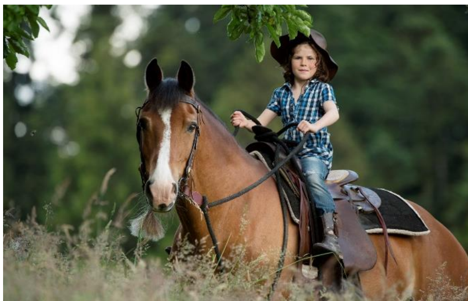
Une adéquation cheval-cavalier est très importante pour la sécurité du cavalier et le bien-être du cheval.

La personnalité du cheval, respectivement celle du propriétaire, est un paramètre qui influence la qualité de la relation homme-cheval et par conséquent, le bien-être équin. Dans cette étude, nous avons évalué la personnalité de 2432 propriétaires et chevaux à l'aide de questionnaires. 40 chevaux ont en plus été testés dans des tests de personnalité. Par la suite, nous avons confronté les résultats du questionnaire équin aux résultats des tests de personnalité puis investigué quelles composantes de la personnalité équine, respectivement de la personnalité des propriétaires, contribuent à la qualité de la relation humain – cheval. Des corrélations entre les scores de personnalité obtenus grâce au questionnaire pour les chevaux, respectivement pour les humains ont montré, tout d'abord, que les cavaliers ayant un score de stabilité émotionnelle plus élevé percevaient leurs chevaux comme étant stables émotionnellement. Des corrélations ont montré dans un deuxième temps que les cavaliers consciencieux décrivaient leurs chevaux comme étant également consciencieux.