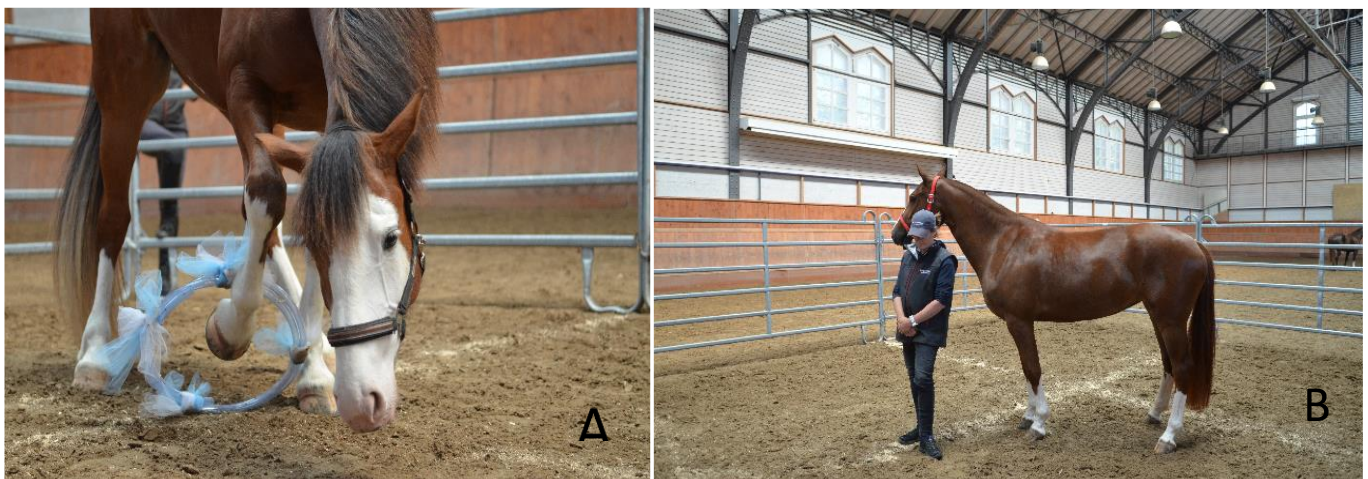
A) test de l'objet inconnu