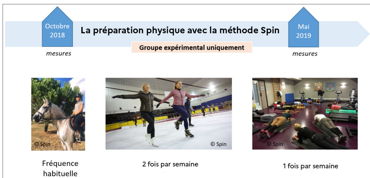
Figure 3 / Le planning de l'étude

Douze cavaliers, d'âge moyen 30,3 \pm 8,9 ans, de niveau amateur (galop 7), ayant au moins le niveau BPJEPS dans l'une des disciplines olympiques et/ou sortant en épreuves de 110 à 140 cm en saut d'obstacles, initialement non-patineurs, ont participé à l'étude (cf. figure 2). Six d'entre eux ont suivi les trois séances hebdomadaires de la méthode Spin (groupe patineurs P). Les six autres cavaliers n'ont pas modifié leur pratique habituelle (groupe non-patineurs NP). Des mesures des cavaliers à cheval ont été effectuées une semaine avant le début du programme, en octobre 2018 (session 1), et 15 jours après l'arrêt du programme, en mai 2019 (session 2) (cf. figure 3). L'âge moyen des deux groupes était de 27,0 \pm 2,7 ans pour le groupe P et de 33,5 \pm 10,8 ans pour le groupe NP.