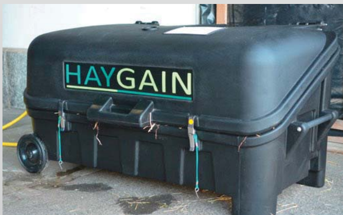
Fig. 1: Appareil de traitement à la vapeur utilisé pour cette étude Abb. 1: Gerät, welches zum Heudämpfen im Versuch eingesetzt wurde

Le traitement à la vapeur n'a eu quant à lui qu'un léger impact sur les nutriments. Dans le foin rincé à l'eau, au contraire, plus le traitement était long, plus la teneur en sucres a diminué. Cette diminution est à mettre sur le compte de l'effet de lessivage, mais aussi de l'activité des levures, qui ont décomposé une partie des sucres.