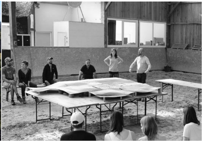
8) Centre de médiation équine « A cheval sur soi » ?